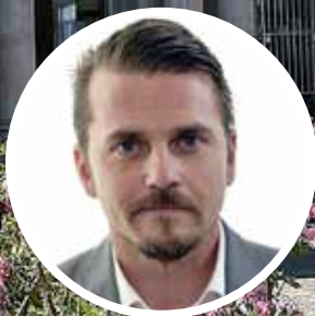
Jimmy Ståhl Riksdagsledamot